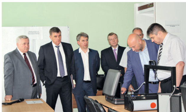
В одной из учебных лабораторий МИИТа