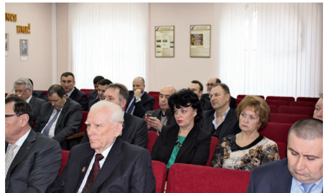
В зале заседания